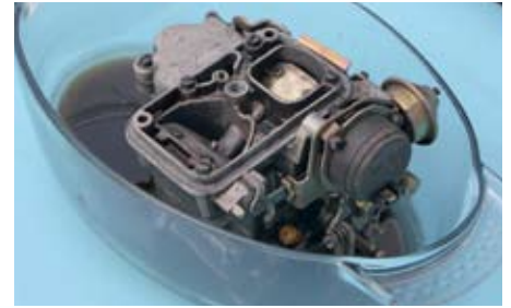
Nicht alle Vergaser sehen so gut aus wie dieser: Im korrosionsverdächtigen E10 hielten sie sich am besten – damit haben wir nicht gerechnet