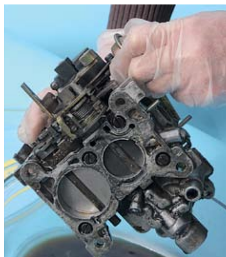
Kein Problem: E 10 plus Bactofin schnitt am besten ab. Der Vergaser ist völlig einwandfrei, ähnlich sahen auch die übrigen E-10-Proben aus

Text: Daniel Bartetzko d.bartetzko@oldtimer-markt.de