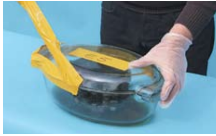
Gelöster Schmutz sorgte für die Verfärbung des Benzins – und in manchen unserer Gefäße auch die zersetzten Schlauchleitungen