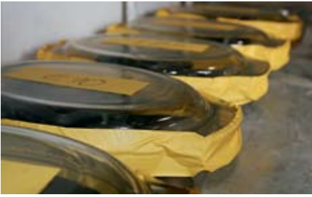
Ein Jahr reiften unsere Ansätze lichtgeschützt und gut abgedichtet im Regal. Von den jeweils vier Litern Kraftstoff blieb trotzdem wenig übrig