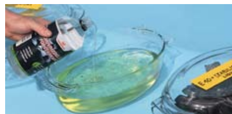
April 2011: Wie schützen Benzinzusätze Vergaser und Spritschläuche in E-10-Kraftstoff? Sechs Testgefäße setzten wir an und warteten ein Jahr