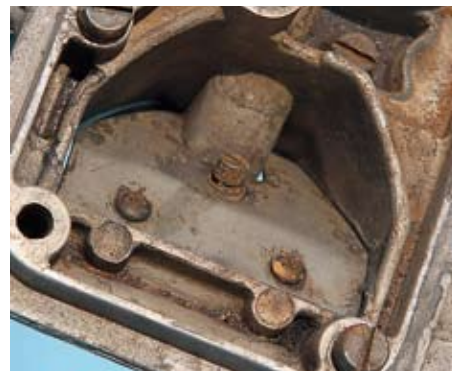
Korrosion im E-5-Vergaser: Die hierfür verantwortliche Entmischung von Ethanol und Otto-Kraftstoff ist gerade bei relativ niedrigem Alkoholanteil unter zehn Prozent ein Problem

Kraftstoff reagiert Ethanol aggressiver als bei höherem – wie etwa in E 10. Dies lässt sich durch die Aufhebung der Wasserstoff-Brücken-Bindungen des Ethanols erklären, die bei E5 erheblich ist und mit zunehmender Ethanolkonzentration im Kraftstoff wieder abnimmt. Wenn die höchstmögliche Wasserkonzentration erreicht ist, setzt eine Entmischung der Inhaltsstoffe ein. Das schwerere Wasser plus Ethanol setzen sich ab und fördern nun die Korrosion. Die Bildung von Gum, jener klebrigen und geruchsintensiven Masse, die sich im Benzin absetzt, hat hiermit übrigens nichts zu tun. Gum entsteht nicht durch Entmischung, sondern durch Alterung des Ottokraftstoffs. Dass dieser Prozess beim vorliegenden E 5 so schnell einsetzt, ist aber ungewöhnlich. Ebenso, dass die Schläuche derart beschädigt sind“, erläutert er. „Der Zerfall des Aluminiums durch E 85 ist vorhersehbar, da es durch hohe Konzentration an Ethanol zersetzt wird. Die festgestellte Verschmutzung ist Folge der nicht in ausreichendem Maße vorhandenen konservierenden Additive. Sie sind nur in den zugesetzten 15 Prozent Ottokraftstoff enthalten und wirken in diesem Mengenverhältnis nicht mehr. Der gute Zustand der Gummischläuche ist leicht erklärbar: Die meisten Elastomere werden von Ethanol kaum angegriffen.“