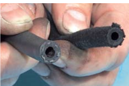
Der moderne Vollgummischlauch (l.) sollte mittlerweile erste Wahl sein, er ist auf heutige Kraftstoffe zumindest besser abgestimmt als der Textilmantel-Klassiker

Das eben dieser Reaktion verdächtige E 10 schneidet viel besser ab. Trotzdem nicht so gut: In der Probe ohne Konservierungsmittel bildete sich Kondensat. Der Kraftstoff ist dunkel gefärbt, da er Verunreinigungen löste, und auch die Schlauchstücke sind angegriffen. Die äußere Lage des Gummischlauches hat sich geweitet. Der Textilmantel des zweiten Exemplars ist dagegen geschrumpft. Allerdings wären die Leitungen beim Startversuch wohl dicht: Die benzinführende Gummierung ist