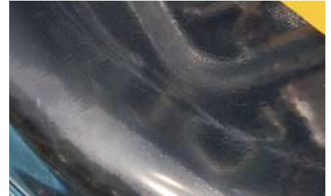
Kondensat im E-10-Ansatz: Bei den Proben mit Konservierungsmitteln trat dies nicht auf. Der Vergaser war allerdings frei von Korrosion

für dessen Ethanol-Produktion landwirtschaftliche Monokulturen entstanden, gar nicht zu reden. Dazu kommt der niedrigere Brennwert von Ethanol, folgerichtig ein Mehrverbrauch E-10-betriebener Fahrzeuge (Heft 4/2011: „Anonyme Alkoholiker“).