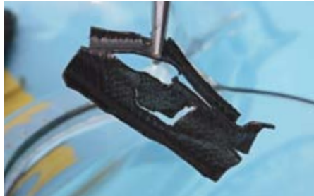
Ich war eine Gummileitung: Ausgerechnet im E-5-Kraftstoff wurden alle Benzinschläuche völlig zerstört – das haben wir so nicht erwartet