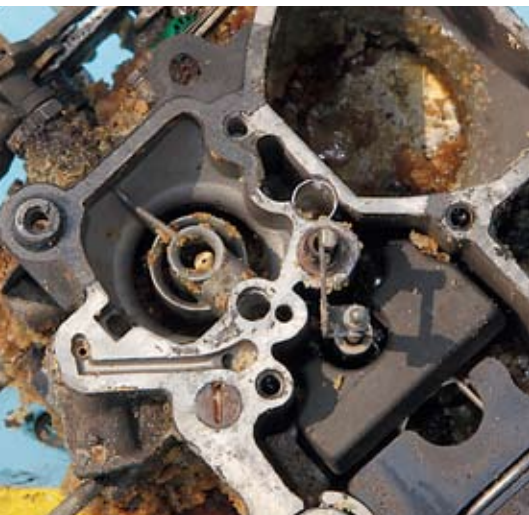
Der totale Zerfall von E 85 überrascht nicht: Konservierende Additive sind nur im Otto-Kraftstoff enthalten. Sie sind aber durch das Mischungsverhältnis 85 zu 15 fast unwirksam

weicher geworden, aber intakt. Völlig unbeeinträchtigt blieb der Vergaser, der frei von jeglicher Oxidation ist, auch beim Blick in die Schwimmkammer lässt nichts Verdächtiges erkennen. Sensorisch ist der Kraftstoff einwandfrei – hiermit wäre jedes Fahrzeug startbar.