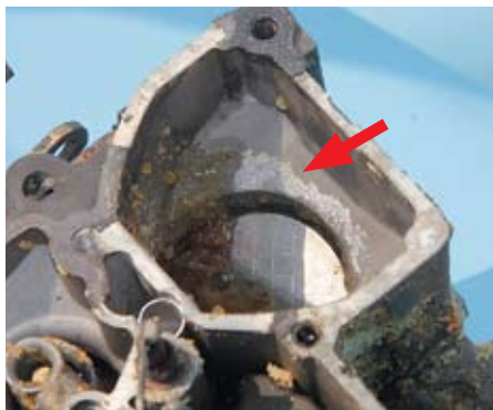
Die Zerfallsprodukte dürften vom Ethanol stammen, denn sie greifen das Metall an: Die schützende Patina auf der Oberfläche ist unter den krümeligen Resten bereits verloren (Pfeil)